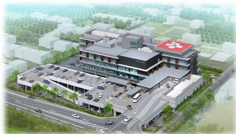
新病院イメージ図