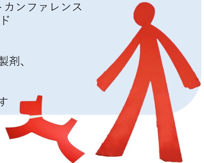
東海病院のシンボル

当院の基本理念は「医療の倫理を守り、安心して安全な質の高い医療を提供し、かかりつけ医として地域社会に貢献します」です。当院は高度医療を提供できる病院ではありませんが、地域のかかりつけ病院として、高度医療機関や地域の開業医や薬局、行政等と連携を密にし、地域の皆さんが安心して日々過ごしていけるように努めています。