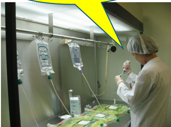
高カロリー輸液調製 無菌調製室