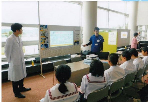
お仕事スタジアム（中学生の仕事体験）