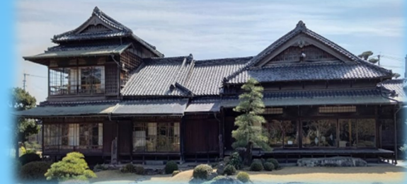
旧伊藤伝右衛門邸 筑豊の五大炭鉱王