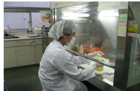
抗がん剤調製・安全キャビネット

中学生を対象とした「お仕事スタジアム（飯塚市主催）」では、多くの職業に触れ体験させ、将来何がしたいか考えてもらう企画で、毎年行われている（最近では新型コロナのため中止）。看護師、キャビンアテンダント、警察官にも負けないうらい薬剤師の魅力を宣伝しました！